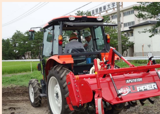
トラクターの耕耘体験