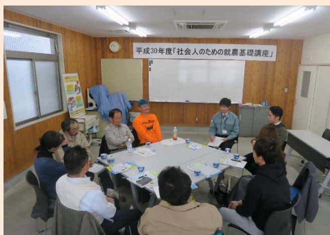
農家との意見交換会