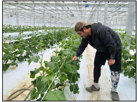
営農を開始された入植者 (ハウスは左写真の中央)