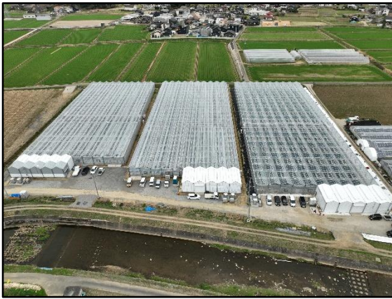
武雄市園芸団地(朝日) (左2棟がR7.1完成分)

入植者の一人は、トレーニングファームで研修した技術をしっかりと活かし、この団地が全国トップクラスに発展するよう頑張りたいと意気込みを語っていました。前年に入植された先輩農家は、就農1年目から部会上位の反収を上げておられ、先輩と一緒に地域農業の活性化を図っていただけるものと期待しています。